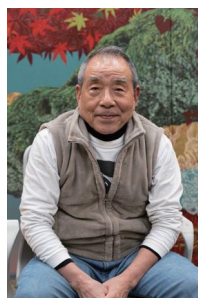
蕨市美術連盟会長 蕨市文化協会会長