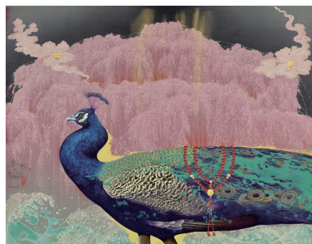
「往くものたちへのPavane」114×146 cm