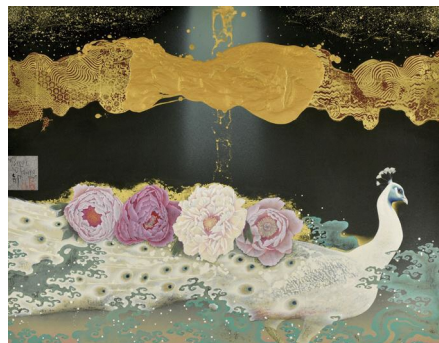
「渉るものたちへのPavane」114×146 cm