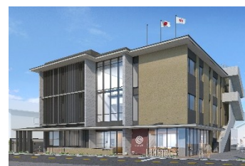
西公民館等複合施設のイメージ

市立病院の建替えに伴い移転整備する、西公民館と老人福祉センターとの複合施設建設工事を引き続き実施。令和8年度完成予定。あわせて、新施設で必要となる備品の購入のほか、西公民館及び松原会館の解体工事の設計などを実施。