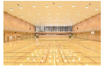
空調設備を整備する市民体育館アリーナ

運動環境の向上と災害時の避難所として避難者の生活環境の改善を図るため、市民体育館アリーナに空調設備を設置。令和8年度は、整備工事の設計を実施。