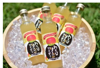
わらびりんごサイダー（返礼品の例）

ふるさとわらび応援寄附金を受け付ける、ふるさと納税ポータルサイトを、1サイトから複数サイトに拡充し、寄附者へのアピールを強化。