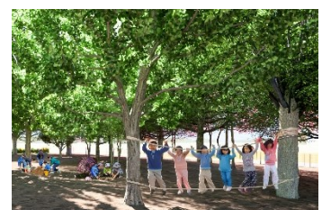
錦町1号公園のイメージ

塚越グラウンド改修工事実施設計のほか、自然と触れ合える錦町1号公園やボール遊びのできる蕨市民公園ボール広場といった、特色ある公園の整備工事などを実施。