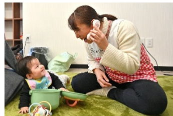
すべての子育て家庭への支援を強化

0歳6か月から満3歳未満までの、保育所などに通っていない子どもを対象とする「こども誰でも通園制度」の開始に伴い、同制度を実施する保育所などに費用の一部を給付。