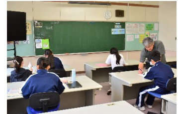
校内教育支援センター（e-sta.）の様子

不登校児童生徒が安心して教育を受けられる校内教育支援センター（e-sta.）を、市内3中学校に加えて、新たに市内7小学校を対象として、南小・中央東小・西小・東小に設置。