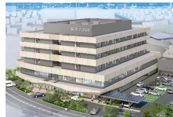
新病院のイメージ

移転建替えを行う市立病院に対して、新病院建設実施設計等に係る負担金を計上するなど、繰出基準に基づき、一般会計からの負担金を増額（負担金総額558,860千円）。