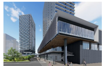
駅西口市街地再開発事業のイメージ

炭駅西口地区市街地再開発組合が実施する工事費などに対して補助金を交付し、事業の推進を図る。