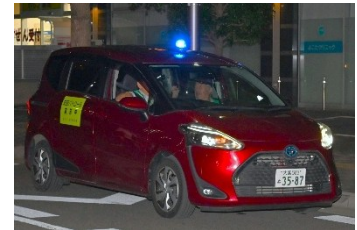
蕨駅東西口周辺で実施の防犯パトロール

防犯対策の更なる充実に向け、帰宅時間帯の蕨駅東西口周辺において、青色回転灯搭載車両による防犯パトロールを、期間を拡充して実施するほか、新たに警備会社による徒歩での防犯パトロールを実施。