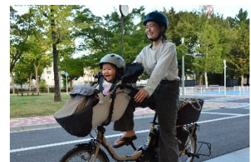
自転車乗車時はヘルメット着用を

自転車乗車時のヘルメット着用をいっそう促進するため、令和7年度末までとしている自転車用ヘルメットの購入に対する補助（補助率1／2、上限2,000円）を、令和8年度も実施。