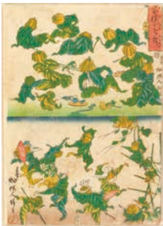
暁斎筆「家保千家の戯」 元治元年（1864）さの貞 大判錦絵 本作品は現在の展覧会で御覧いただけます

頭が南瓜で胴体が南瓜の葉の「家保千家」が上段では足相撲や首引きなどのさまざまな相撲を取り、下段では盆踊りに興じています。本図は暁斎が数え7歳で入門した歌川国芳の「ほふづき（ほおずき）づくし」シリーズを基にしていますが、暁斎は背丈のバランスを人間に近づけるとともに、葉の先端の細い部分を手足に見立てたり、腕相撲で組んだ手から腕を蔓にしたりするなど、「家保千家」をより躍動的に描いています。顔に表情はなくとも、喜怒哀楽が伝わってくるような楽しい作品です。