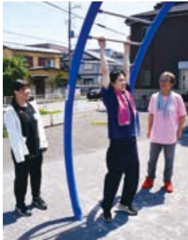
▲ちびっこ広場No.7 (中央)

市内の公園などに設置されている健康遊具。昨年度は新たに5か所・8基を設置し、合計14か所・43基となりました。今年度は更に、5か所・10基増設予定です。健康遊具はストレッチや軽い運動、筋力トレーニングなどが気軽に行え、介護予防にも効果的です。ウォーキングなどの際には、ぜひ、健康遊具もご利用ください。