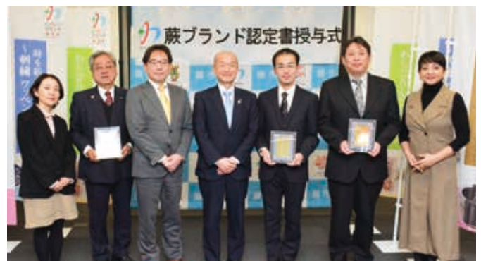
▲蕨ブランド認定書授与式 (2月20日)