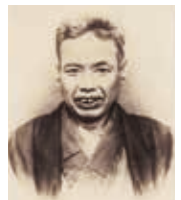
かわなべ きょうさい 河鍋 暁斎 天保2年（1831） ～明治22年（1889）

現在の茨城県古河市に生まれる。浮世絵や狩野派を学び、江戸・東京の庶民から人気を博す。明治9年、万国博覧会に肉筆画を出品。14年、内国勲業博覧会で日本画の最高賞受賞。娘の暁翠も日本画家。