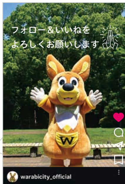
▲すてきな写真や動画で蕨の魅力をお届け