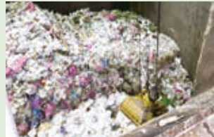
▲ごみピットをセンサーで監視