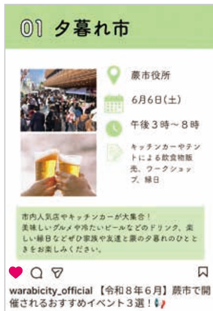
▲毎月おすすめイベントを紹介

写真や動画を通して蕨の魅力を発信するため、市公式のInstagramを開設しました。ぜひ、フォローやいいねをお願いします。