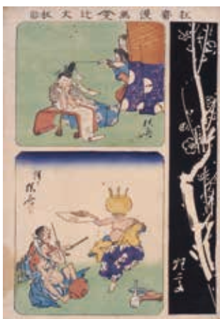
本作品は現在の展覧会で御覧いただけます

右側は、黒地に描線を白く抜いた「石摺絵」で、闇夜に浮かぶ白梅を描いています。左上はいたずらされる平安貴族、左下では『徒然草』第52段「仁和寺の僧」より、「鼎踊り」をする僧侶が描かれています。一つ一つが独立しているが、どこか関連があるような作品が取り合わされており、あれこれ想像するのが楽しくなる作品です。