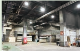
▲粗大ごみ処理施設を再整備