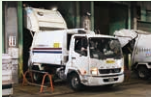
▲もやすごみの焼却を再開