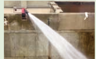
▲新設する放水銃(イメージ)

これらの取組の財源として、国の循環型社会形成推進交付金や火災保険の支払金を活用します。