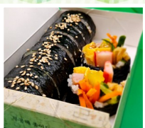
KOREANFOODTRUCKしんちゃん キンパ、チーズタッカルビ弁当