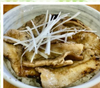
きっちゃんPICO 豚丼、牛筋カレー