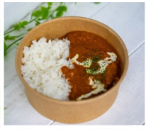
TeaFarm茶夢 バターチキンカレー