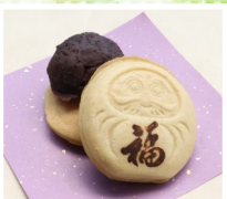
米粉だるま焼き 八起き だるま焼き