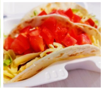
BLUE3号 タコス、タコライス