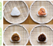
むすび家あさひ おむすび