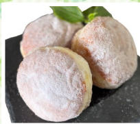
MALASAPOP マラサダドーナツ