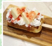
情熱キッチンカー 米粉ワッフル