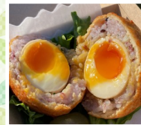
MOBILE BASE ポムライス