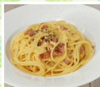
AKIMOキッチン 生麺パスタ