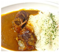
Curry is Friday 海自カレー