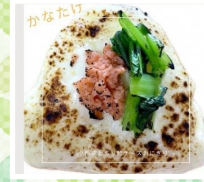
おにぎり屋かなたけ おむすび