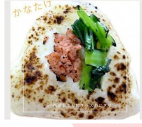
おにぎり屋かなたけ おむすび