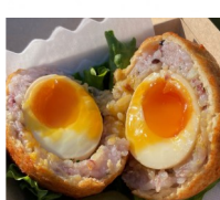
MOBILE BASE ボムライス