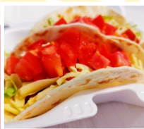
BLUE3号 タコス、タコライス