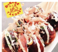
めっちゃうまたご源 たこ焼き、沖縄ドーナツ