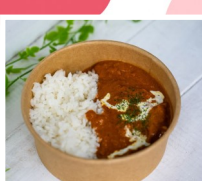
TeaFarm茶夢 バターチキンカレー