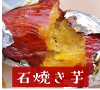
258(ふたごや) 焼き芋スイーツ