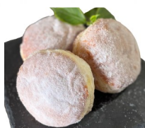
MALASAPOP マラサダドーナツ