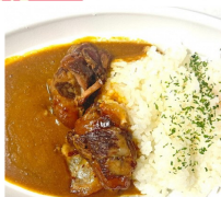
Curry is Friday 海自カレー