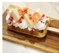
情熱キッチンカー 米粉ワッフル