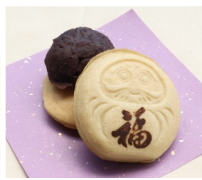
米粉だるま焼き 八起き だるま焼き