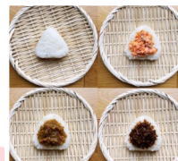
むすび家あさひ おむすび