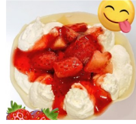
紫陽花堂 クレープ