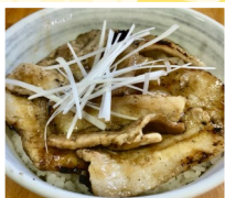
きっちゃんPICO 豚丼、牛筋カレー