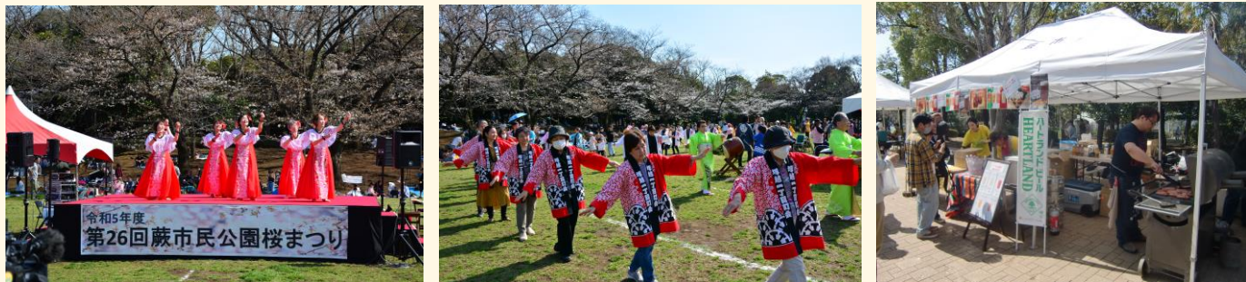
▲去年の「蕨市民公園桜まつり」の様子

申込み等の詳細は、後日東公民館に配架するチラシ等をご覧ください。多くの方のお申込みをお待ちしております。