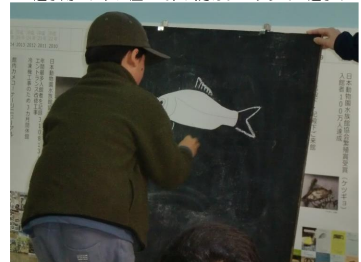
▲アクアスクールで魚の「ひれ」について学びました

12月26日(木)に、冬休みバスツアー「親子で埼玉のスタジアム&水族館見学!」を実施しました。バスツアーでは、始めに「埼玉スタジアム2002」を訪れ、参加者は普段選手たちしか入れない選手控え室の見学や、選手用ベンチに実際に腰掛けるなど、貴重な体験をすることができました。また、「さいたま水族館」では、県内で確認されている魚類や両生爬虫類など130種の生き物が展示されており、埼玉県内のみ生息する「ムサシトミヨ」など、私たちの身近なところにいる意外な生き物たちに、参加者は大興奮でした!