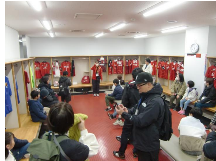
▲選手控え室と歴代選手のユニフォーム