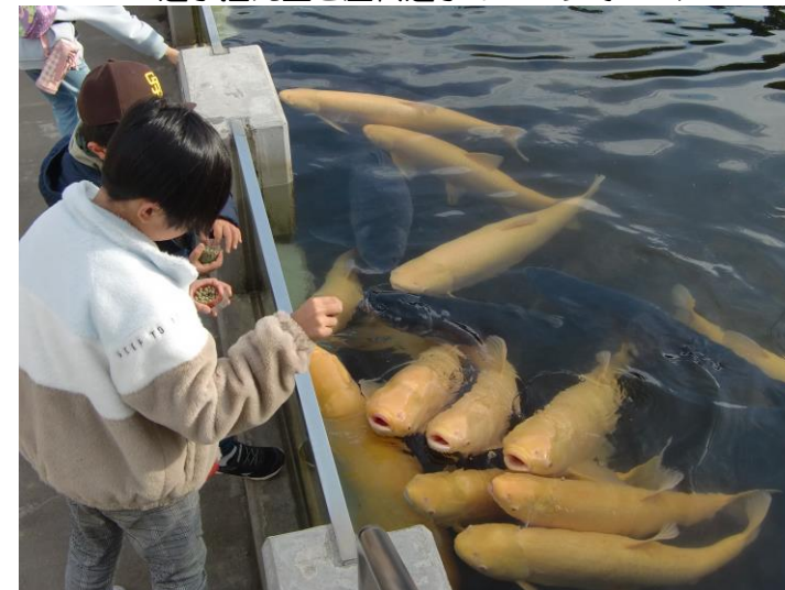
▲大きな鯉に餌やり