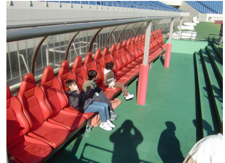
▲選手用ベンチに座って、気分はプロサッカー選手!