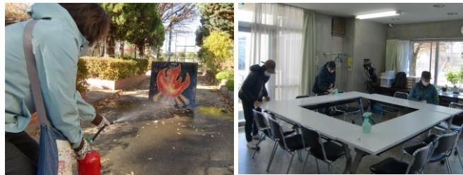
▲火の根元を狙います ▲ピカピカになりました

12月12日(木)に、公民館利用団体の皆さまにご協力いただき、消防訓練と年末大掃除を行いました。消防訓練では、館内で火災が発生したことを想定して、避難通路から避難しました。また、水消火器を使用して、消火器の使い方を学びました。大掃除では、机や椅子を一つ一つ丁寧に拭いて、汚れを落としました。ご協力いただいた皆さま、ありがとうございました！