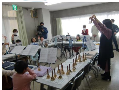
▲12/25「ミュージックベル教室」

小学生対象の「冬休みチャレンジ教室」にて、「ミュージックベル教室」と「書き初め教室」を開催しました。12月25日(水)の「ミュージックベル教室」では、初めて触るミュージックベルに、参加者は慣れるまで悪戦苦闘しましたが、最後には、みんなでクリスマスソングを演奏することができました。また、1月6日(月)の「書き初め教室」では、講師の先生に書き方を丁寧に教わりながら、冬休みの宿題の書き初めに集中して取り組み、筆を進めていました！