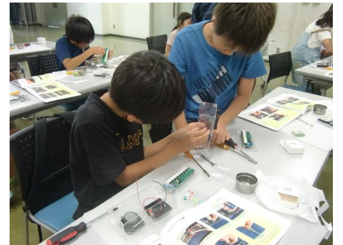
▲8/5(月)「手づくり電子ピアノを作ろう」