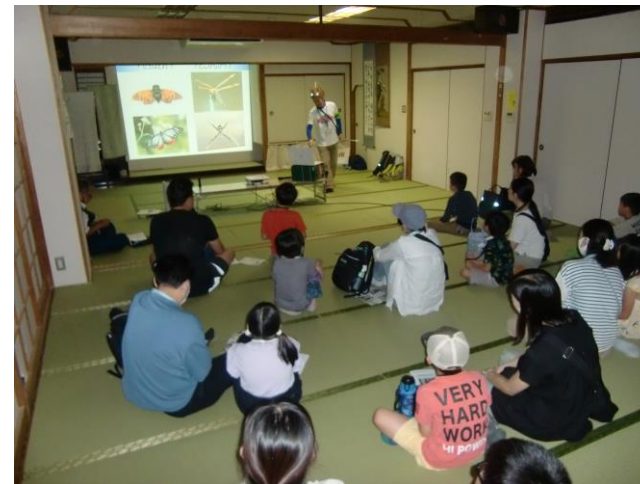
▲7/26(金)「セミの羽化観察教室」

今年の夏休みチャレンジ教室は、「セミの羽化観察教室」「手づくり電子ピアノを作ろう」「アンガーマネジメント教室」「夏の星座観察教室」の4本立てで開催しました。「手づくり電子ピアノを作ろう」では、日本アンテナ株式会社のご協力のもと、工作キットを使い、子どもたちは自分でネジを差し込み、出来上がった自分だけのオリジナル電子ピアノを楽しそうに弾いていました！また、「アンガーマネジメント教室」では、小学1～6年生までの子どもたちが、先生の話をしっかり聞いて、感情を上手にコントロールする方法を学びました！