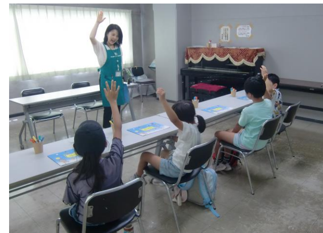
▲8/7(水)「アンガーマネジメント教室」