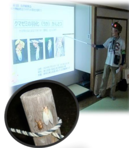
↑羽化したばかりのセミ

7月21日(日)に、「自然観察会」を実施しました。今年の自然観察会は「蕨市民公園の四季」をテーマに、年4回を予定しています。初回は多くの参加者とクマゼミの羽化を観察し、私たちに身近な市民公園の夏を感じることができました！