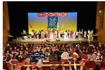
舞台照明設備等の改修を予定する コンクレホール

老朽化したコンク레ホール舞台照明設備等の改修工事の設計や、災害時の避難場所として、避難者の生活環境の改善やトイレ設備の充実を図るため、福祉棟102会議室をトイレとして改修など。