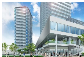
駅西口市街地再開発事業のイメージ

蕨駅西口地区市街地再開発組合が実施する工事費などに対して補助金を交付し、事業の推進を図る。