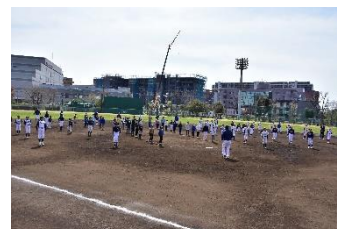
改修を予定する富士見公園内野球場

錦町地区1号公園整備工事の基本設計を実施するほか、富士見公園内野球場の整備や富士見第2公園内テニスコート人工芝の張替、蕨市民公園トイレの洋式化などを実施。