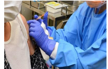
予防接種のイメージ