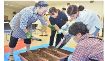
5年度に実施したプランター・ファーム講習会の様子

市内老人ホームや子どもを対象とした公民館事業などで市内農家等が育成した苗木やプランターキットを配布するほか、フォトコンテストを開催し、プランター・ファームを推進。