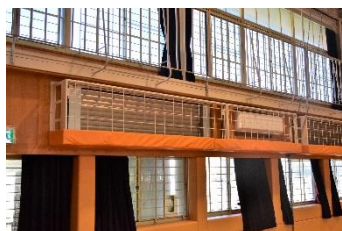
5年度に設置した空調設備(東小学校)

教育環境の向上と災害時の避難所として避難者の生活環境の改善を図るため、学校体育館に空調設備を設置。令和6年度は、西小学校、中央東小学校及び塚越小学校の設置工事を実施。これにより、市内全小・中学校に整備が完了。