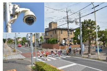
既設の街なか防犯カメラ

犯罪が起きにくい環境づくりを進めるため、街なか防犯カメラを60基増設するほか、家庭用防犯カメラ設置費の1/2を補助（上限額は個人宅2万円、共同住宅10万円）。