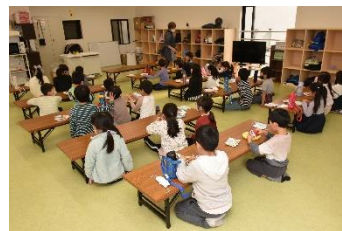
4年度開室の「キッズクラブ厥」の様子

令和6年4月に、市内5カ所目となる民間留守家庭児童指導室「キッズクラブわらび西」(錦町5丁目)が開室。運営費用に対して補助金を交付。これにより、公設留守家庭児童指導室を含む定員数は765人から795人へ拡充。