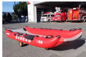
消防本部所有の救助用ボート

集中豪雨や台風による冠水対策の強化のため、土のうステーションを各地区1基ずつ増設するほか、大規模水害対策の強化に伴う消防団災害用資機材の整備を図るため、救助用ボート2艇を購入。