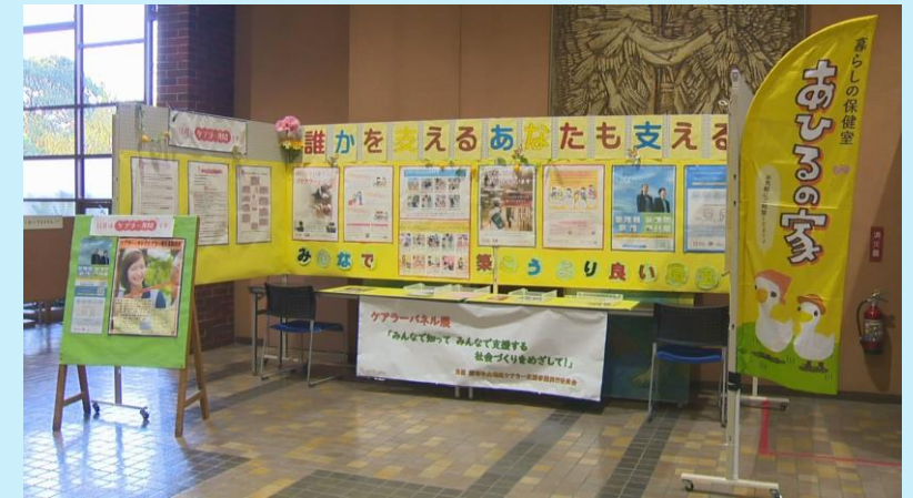
市民団体によるケアラーパネル展の様様