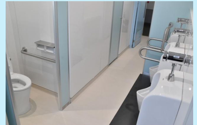
R5年度に改修した第二中学校トイレ