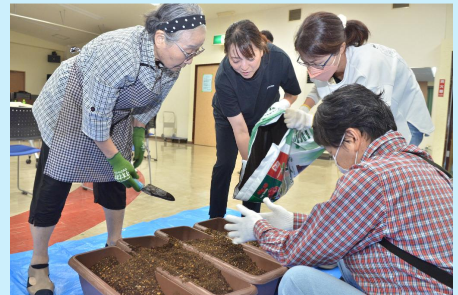
R5年9月のプランターファーム講習会