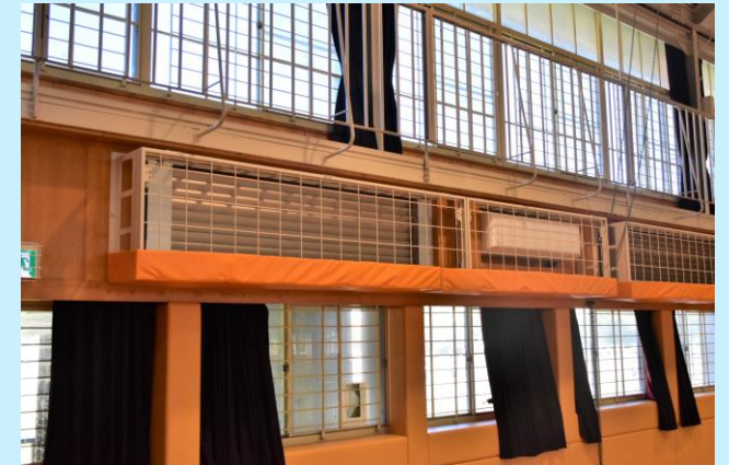
R5年度に設置した東小学校体育館エアコン