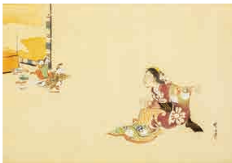
暁斎筆「美人を驚かす内裏雛」軸装

本図は暁斎の娘の暁翠が描いた作品です。晴着を着た若い娘が驚いた表情で尻餅をついています。娘の視線の先を見ると、お内裏様とお雛様が雛壇から降りて、飲んだり食べたりしてくつろいでいたようです。ご機嫌になったお内裏様が娘に向かって「あかんべ」をし、犬笛を抱いたお雛様は