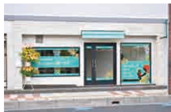
ほっこり～の蕨中央の外観