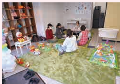
ハイハイ期の赤ちゃんも安心のスペース

とき：金曜日 午後4時～7時 内容：①子ども食堂＝月2回（今月は4回）子ども無料、大人300円（ひとり親等は無料） ②子どもの体験活動（4月から）＝月2回 空手、そろばん、交流イベントの開催など ③フードパントリー＝不定期開催（登録制、ひとり親や低所得の家庭が対象）