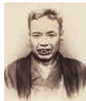
かわなべ ますあさ 河鍋 暁斎 天保2年(1831) ～明治22年(1889)

現在の茨城県古河市に生まれる。浮世絵や狩野派を学び、江戸・東京の庶民から人気を博す。明治9年、万国博覧会に肉筆画を出品。14年、内国勲業博覧会で日本画の最高賞受賞。娘の暁翠も日本画家。