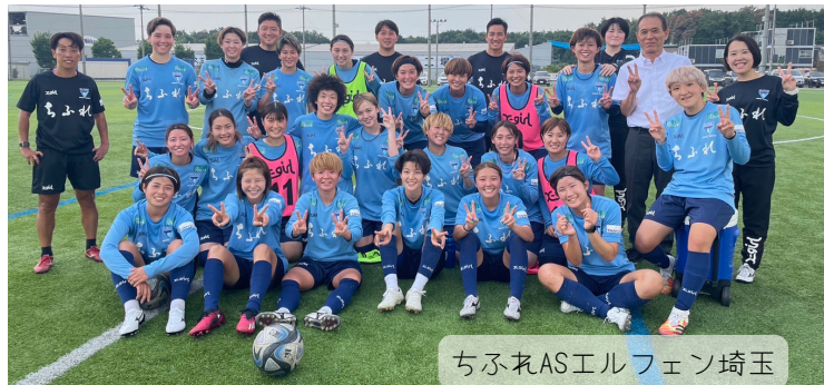
ちふれASエルフェン埼玉