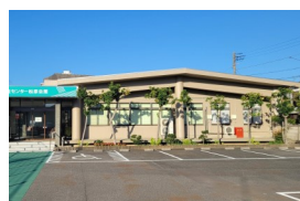
松原会館 (昭和45年建築)