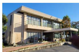
西公民館 (昭和53年建築)

蕨市立病院の移転候補地にある西公民館・松原会館は、寄附をいただいた錦町地域の土地に移転し、複合施設として整備します。