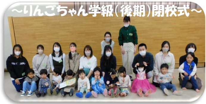
～いんごちゃん学級(後期)閉校式～