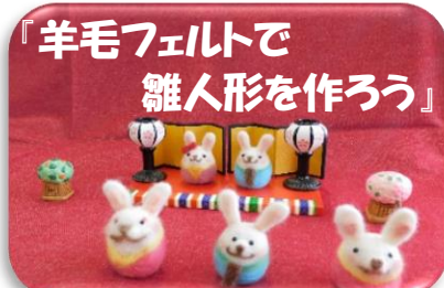
『羊毛フェルトで雛人形を作ろう』