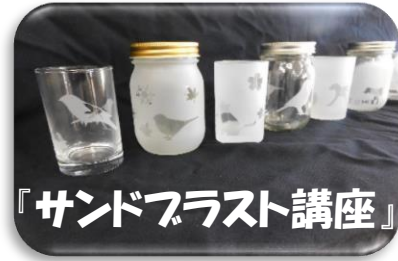
『サンドフラスト講座』

その後は料理教室でアジのピカタとサバの香草パン粉焼きを作りました。この講座が魚を捌くきっかけとなると良いです。