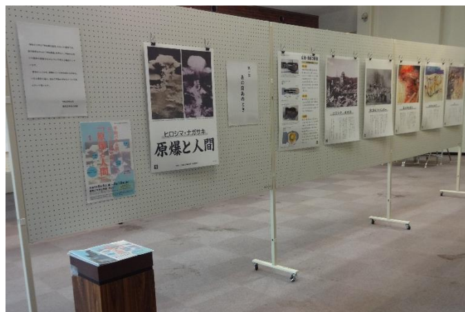
▲平和パネル展「ヒロシマ・ナガサキ原爆と人間」

平和都市宣言を行っている蕨市では、毎年夏に各公民館で「平和事業」を実施しています。中央公民館では8月17日（木）に、平和を願う紙しばい「蕨の成年式ものがたり」を開催しました。蕨市立第二中学校美術部の生徒が描いた「成年式」の絵をもとに、シニア読み聞かせじゃんけんぽんの皆さんが紙しばいを上演しました。子どもから大人までが楽しみながら平和について考えました。