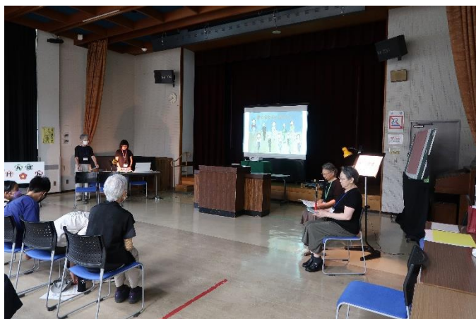
▲平和を願う紙しばい「蕨の成年式ものがたり」 出演：シニア読み聞かせじゃんけんぽん