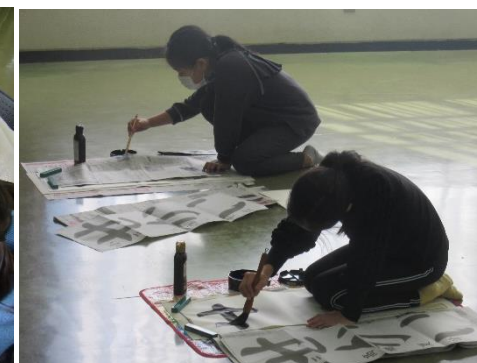
1月5日 書き初め教室

小学生対象の「冬休みチャレンジ教室」にて、「折り紙教室」、「書き初め教室」を開催しました。12月26日(火)の「折り紙教室」では、獅子舞と富士山のお正月飾りを作り、1つ1つ顔や模様が違った素敵な飾りが完成しました。年明けの「書き初め教室」では、学年ごとに宿題の書き初めに取り組み、集中して筆を進めていました。