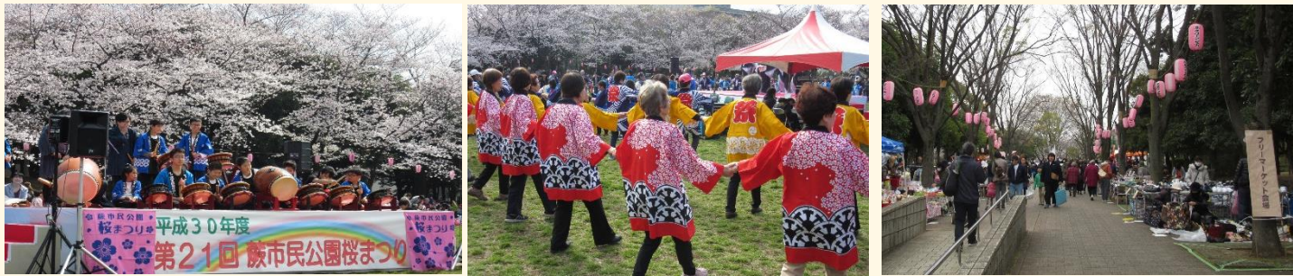
▲「第21回 蕨市民公園桜まつり」の様子

申込等の詳細は、後日東公民館に配架するチラシ等をご覧ください。多くの方のお申込みをお待ちしております。