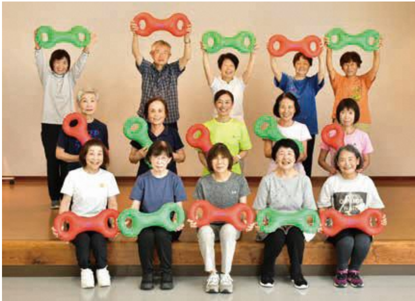
松原会館の趣味講座「3B体操」の参加者の皆さん