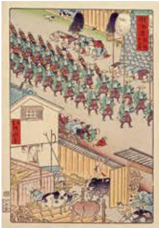
暁斎筆「東海道 高輪牛ご屋」 文久3年 大金板 大判錦絵