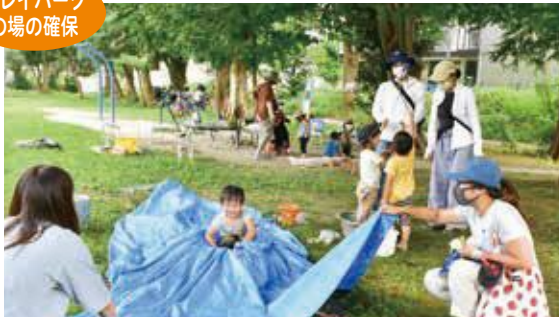
プレイパーク の場の確保