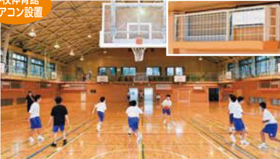
各小・中学校の体育館へのエアコン設置を推進(写真は東中学校)