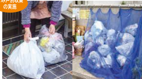
ごみ戸別収集 の実施