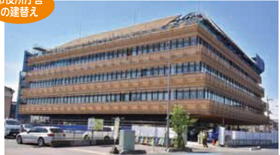
完成が近づいてきた今年秋開庁予定の新庁舎(4月19日撮影)