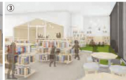
右イラスト：北側から見た第2工区（基本設計時のイメージ） 上イラスト：図書館イメージ/①開放感のある総合カウンター ②エントランスロビー(イラスト右側がカフェ) ③読み聞かせ室などを備えた子どもエリア