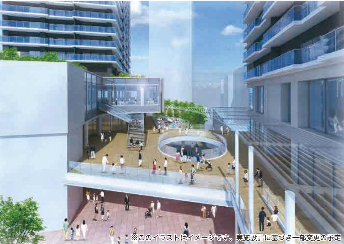
※このイラストはイメージです。実施設計に基づき一部変更の予定

第2工区は、令和2年8月に県から再開発組合の設立認可を受け、本格的に始動。昨年8月には、同組合は全ての権利者の同意をいただいた上で県から権利変換計画の認可を取得しました。そして同月から地区内の道路を閉鎖し、既存建築物等の除去解体工事を開始。今年1月末には地区内の全ての既存施設の引き渡しも完了し、いよいよ本格的な建設工事の着工に向けて動き出しています。