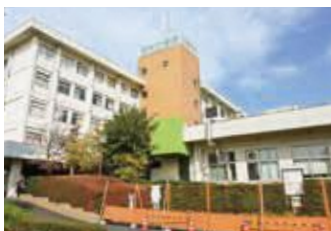
地域の中核病院としての役割を果たす市立病院