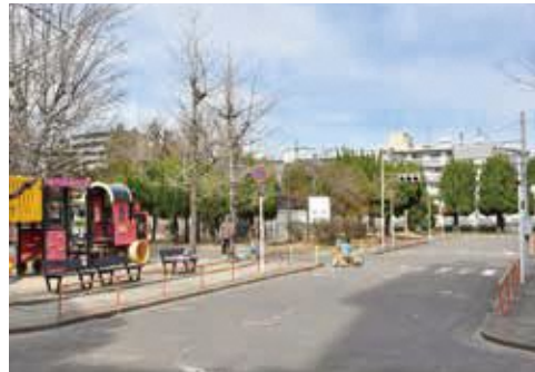
老朽化した施設を改修するほか、芝生広場、幼児専用ゾーン、障害者や妊産婦のかたなどのための駐車場(2台分)も新設します。