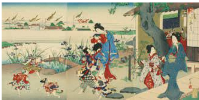
暁翠筆「五節句之内 皇月」 大判錦絵三枚続

暁斎の娘の暁翠が5月5日の端午の節句を描いた錦絵です。この日の主役の男の子たちが、兜や鉢巻姿で勇ましく遊んでいます。烏帽子をかぶった子が右手に持っているのは菖蒲の葉を