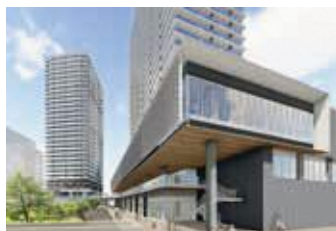
蕨駅西口再開発事業整備後のイメージ