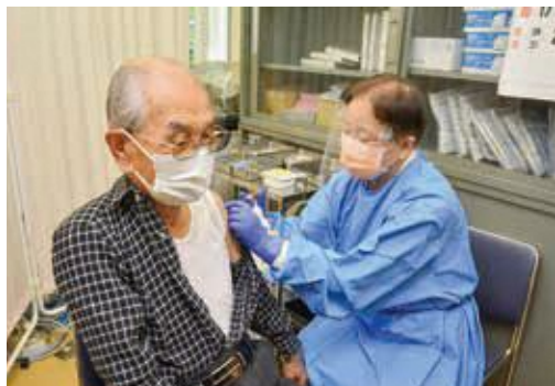
引き続き新型コロナウイルスワクチン接種事業を推進