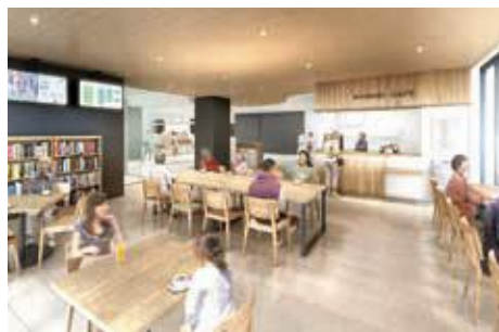
カフェスペースイメージ