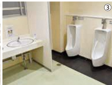
①子どもたちの笑顔が 広がるまちに ②オフライン環境でも 利用できるデジタルドリル を導入します ③今年度は小学校3校、 中学校1校でトイレの 改修を実施（写真は昨 年度に改修した中央東 小学校のトイレ）