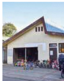
建て替えられる同園の管理事務所