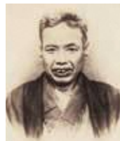
かわなべ きょうさい 河鍋 暁斎 天保2年(1831) ～明治22年(1889)

現在の茨城県古河市に生まれる。浮世絵や狩野派を学び、江戸・東京の庶民から人気を博す。明治9年、万国博覧会に肉筆画を出品。14年、内国勲業博覧会で日本画の最高賞受賞。娘の暁翠も日本画家。