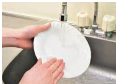
一般家庭3,960円、事業所4,400円負担軽減