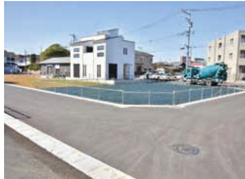
着実な推進を図る錦町土地区画整理事業(写真は道路や宅地の整備が完了した錦町3丁目の一街区)