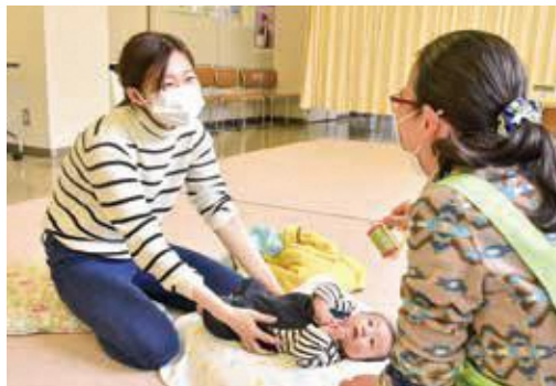
身体測定や診察、育児相談などを通じて、健やかな成長につなげていきます