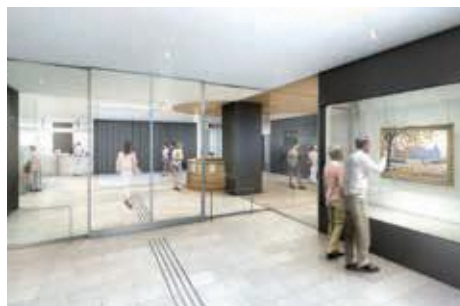
正面玄関イメージ

新庁舎建設の基本理念「－歴史・文化を活かし『未来の蕨』を創造－人と環境にやさしく、市民に親しまれ、安全でコンパクトな庁舎」に基づき、着実に進めています。今年度は建設工事のほか、新庁舎への移転・開庁、市民会館の原状復旧などを実施します。