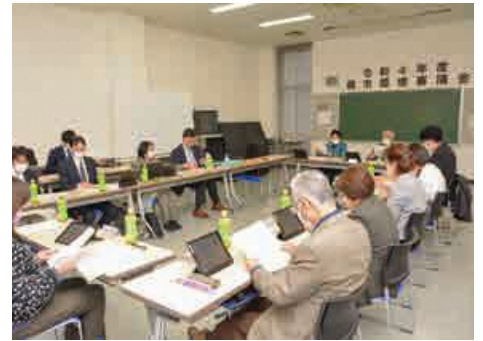
先月開催された第3回蕨市環境審議会の様子