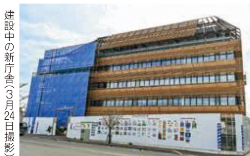
建設中の新庁舎（3月24日撮影）