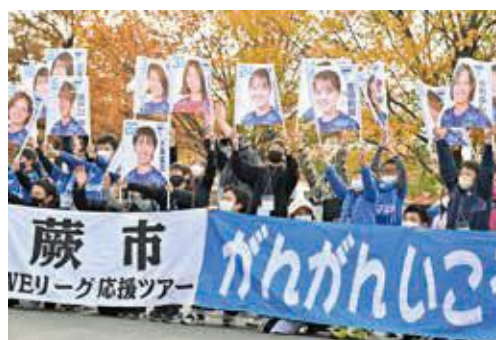
昨年行われたWEリーグ応援ツアー