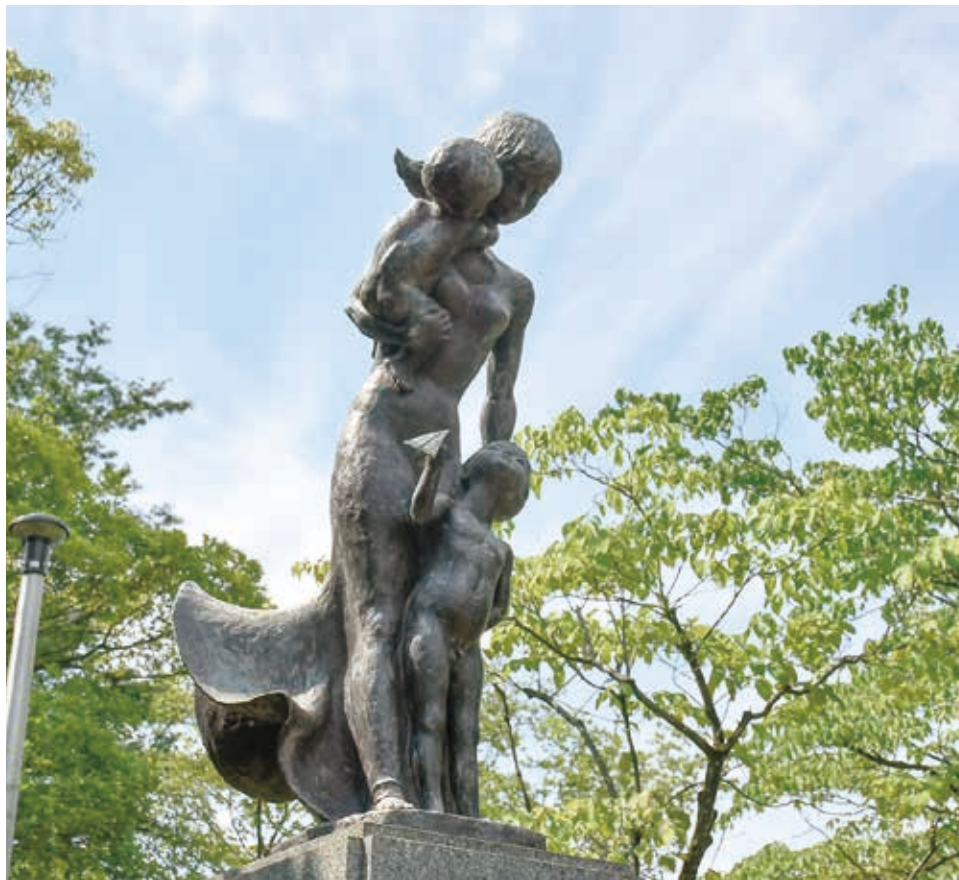
平和の母子像（市民公園）

終戦から78年が経ち、戦争を直接知る世代は少なくなっていますが、あの悲劇を風化させてはいけません。今月は、蕨を襲った空襲について紹介しながら、あらためて平和の尊さについて考えてみたいと思います。