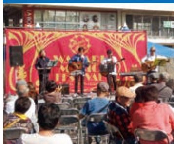
過去に駅西口で行われた音の市の様子

4年ぶりに蕨駅西口ロータリーでの「音の市」が復活。内容 = ジャズ、ポップス、クラシック、アコースティック、ロックンロール、ギター弾き語り、沖縄音楽、津軽三味線演奏ほか ※特設フードブースあり。