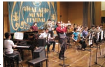
昨年のわらジャズの様子

出演 = Brass Untitled、Quirk Of Fate、LSOP、N・Y BIGBAND、加賀屋ホッピーズ、Rebirth、Royal Feast Club Band、North West Jazz Orchestra、Solid State Drivin' Orchestra 内容 = ジャズ 定員 = 150人 料金 = 無料・観覧自由