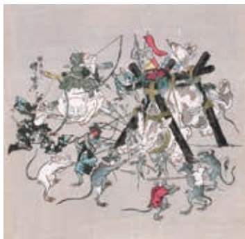
暁斎筆「猫が捕まえる鼠」色紙判錦絵

猫が鼠たちに生け捕られていきます。袴姿や鎧で完全武装した鼠もいるようで、猫もこうなつては降参するしかないようです。暁斎はこの作品と同じ構図の肉筆画も描いています。明治6年（1873）に来日、同13年（1880）に帰国した英国人外科医のウィリアム・アンダーソン（1842〜1900）に依頼されたもので、その作品は現在、アンダーソンが寄贈した膨大な日本美術コレクションとともに、大英博物館に所蔵されています。