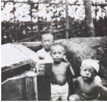
▶当時の防空壕が写った写真

その後は、知り合いの家を転々としました。しかし、みんな自分のことだけでもたいへんでしたので、最終的には父が働いていた工場の寄宿舎に住むことになりました。あれから日本は平和な時代となりましたが、戦争はとても怖いものです。戦争なんて体験しないのがいちばんですから、これからも平和が続くことを願っています。