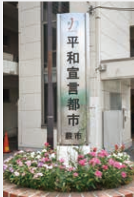
蕨市平和都市宣言塔 (蕨駅西口駅前広場)

毛工場や民家に焼夷弾が落とされました。その後、深夜から14日の朝にかけて、10機ほどのB29による爆弾と焼夷弾の波状攻撃が行われ、三和町(南町2・3丁目付近)から下蕨、土橋、御殿、仲上町を経て蕨第一国民学校(現在の北小學校)までの約1キロ、幅200〜300メートルの広範囲が火の海に。このときの被害は死者12人、全壊または半壊した家屋は約360戸に上りました。