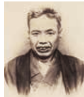
かわなべ きょうさい 河鍋 暁斎 天保2年（1831）～明治22年（1889）

現在の茨城県古河市に生まれる。浮世絵や狩野派を学び、江戸・東京の庶民から人気を博す。明治9年、万国博覧会に肉筆画を出品。14年、内国勲業博覧会で日本画の最高賞受賞。娘の暁翠も日本画家。