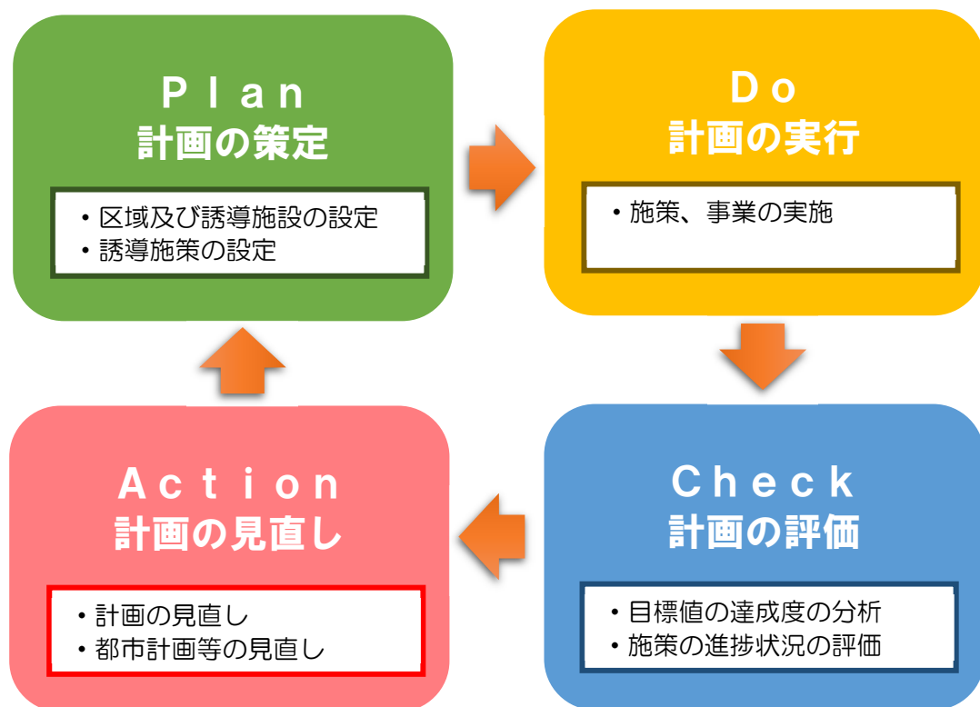
図 計画のマネジメントサイクルのイメージ

具体的には、「PDCA」の流れを持つマネジメントサイクルの仕組みを構築し、設定した目標値によって計画を評価することで、必要に応じた計画等の見直しにつなげていきます。