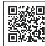
ベトナム語 Tiếng Việt