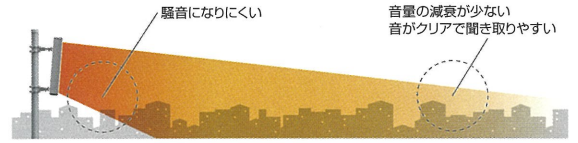
【防災用ソノコラムスピーカー】音の広がり方イメージ