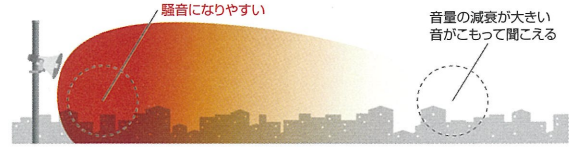
【従来型スピーカー】音の広がり方イメージ