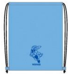
ランドリーバッグ