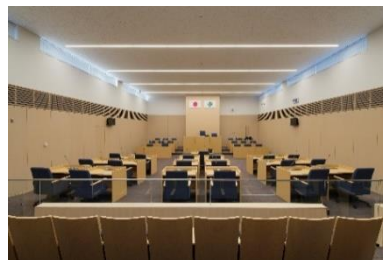
（議場の一部木質化）