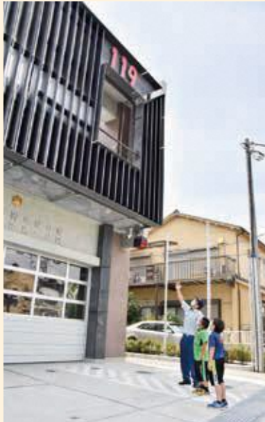
▲「建物の外観は双子織をモチーフにしています」との説明に耳を傾ける二人