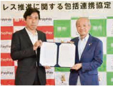
PayPay(株)と包括連携協定を締結