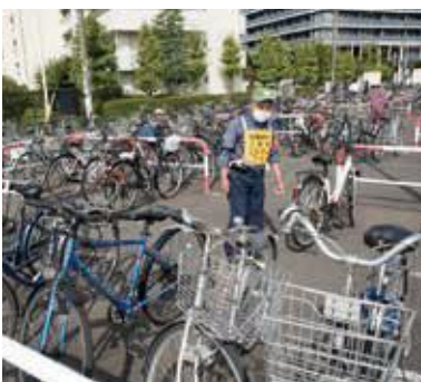
▲駅前駐輪場の管理も仕事の一つ

清掃や除草、施設の管理など約40種類（左表参照）の仕事があり、その人の希望や能力にあつた働き方ができます。講習会などのサポートも充実しており、未経験でも安心。何かを始めたいと考えている人はぜひ、地域という新たな舞台で活動してみませんか。