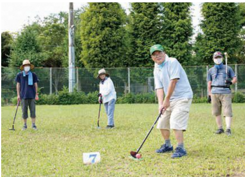
グラウンドゴルフを楽しむ塚越和楽会の皆さん（塚越グラウンド）

市内には65歳以上のかたが、人口の約23%に当たる17,449人いらっしゃいます（8月1日現在）。そこで4、5ページでは、皆さんが元気に暮らせるように実施されている各種福祉事業や制度を紹介します。