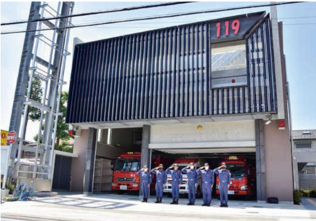
施設の概要／【ところ】塚越4-1-6 【構造】鉄筋コンクリート造一部鉄骨造 【新設備】防火水槽・非常用自家発電設備・女性用仮眠室・多目的トイレ・屋上視認標示・訓練用放水壁・除染室 など

耐震化整備のため、建替え工事を進めてきた消防署塚越分署が、先月25日から供用を開始しました。ここでは、新分署の概要や先月23日の開署式の様子を紹介します。