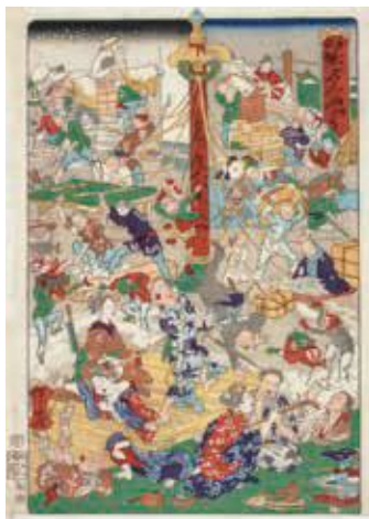
本作品は現在の展覧会で御覧いただけます

「しんぼふ」と書かれた赤い棒から、黄色い糸が垂れ下がっています。その糸につながっている上段の人々は、機織りや農作業など四季折々の仕事を「辛抱」強く励んでいます。一方、糸が棒につながっていない手前の男たちは酒や煙草などに耽っているようです。いちばん左の男は遊女に追いかけられた拍子にひっくり返り、糸が途中から切れてしまっています。幕府が倒れ、開化の波が押し寄せたなか、「心棒」を失った士族たちの姿を風刺しているようです。