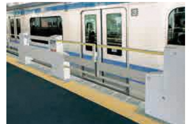
ホームドアのイメージ

蕨 駅ホームドアの整備が当初よりも1年前倒して完了し、今月29日の始発から供用開始となる予定です。市では、平成29年1月の蕨駅での転落事故を受け、ホームドアの早期設置をJR等に求めてきたほか、本事業に関して、国や県とともにJRへ補助を行ってきました。詳細 = 政策企画室 (☎433・7698)