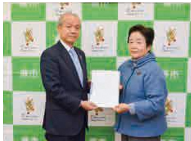
国民健康保険運営協議会から市へ答申（昨年の12月26日）

こうしたことを踏まえ、市では今年度、国民健康保険運営協議会（以下協議会）に「国保税の税率の見直しについて」を諮問。計3回の審議の末、協議会は「医療費の適正化や保険税の収納率の向上などの取り組みに加え、被保険者の負担が急激に増加しないよう、段階的な改定が適当である」といった趣旨の答申をまとめ、昨年12月に市へ提出しました。市では今後、本答申に基づき、来年度から税率を改定するため、議会で条例改正の提案を行うなど手続きを進めるとともに、住民説明会（下囲み）を開催し、市民の皆さんに丁寧な説明を行っていきます。なお、改定後の税額案は右下表のとおりです。