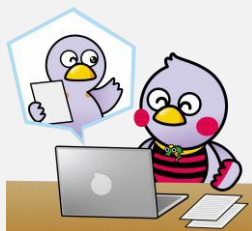
埼玉県マスコット 「コバトン&さいたまっち」