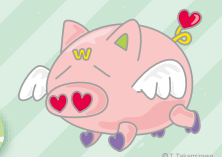
「エンジェルわらぶー」