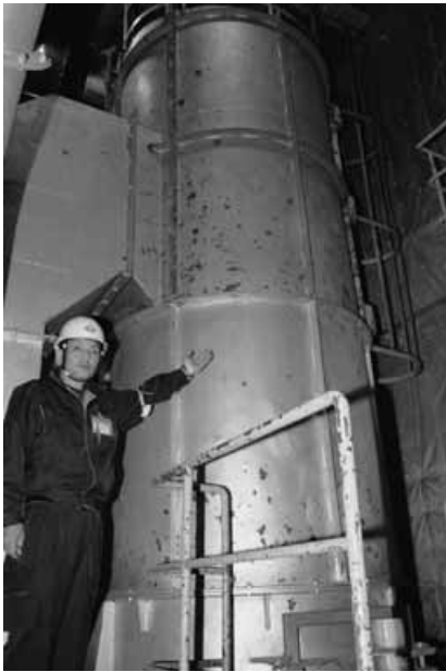
爆発事故発生から1か月以上が経過した現在でも修理をしながらの運転が続く処理施設内の破砕機

万一、施設の処理機能がまひしたら、数日間のごみの収集をストップしなければならぬのが現状です。市民の皆さんの生活に大きな影響を及ぼしてしまいます。