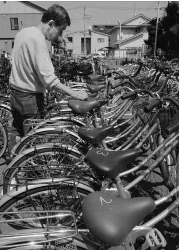
いつも満杯の状態にある自転車保管場所（塚越5丁目）

保管場所に撤去された自転車は、図1の「撤去自転車の行方」のように、保管期間内に引き取りがなかったときの最終手段として、粉碎処分や自転車商組合を通じたりサイクル自転車販売をしています。