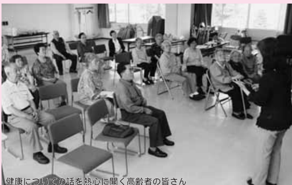
健康についての話を熱心に聞く高齢者の皆さん