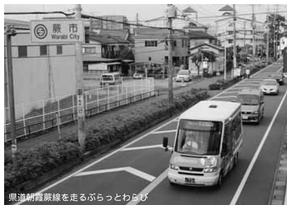
県道朝霞蔭線を走るぷらっとわらび

しが食事やだんらんなどに利用できる共同スペースがあるのが大きな特徴です。これは、入居者全員で1つのコミュニティを形成し、協力し合って暮らすことを目指す、北欧で生まれた新しい形の住まい方「コレクティブハウジング」を参考にしています。そして、この停留所の付近は蕨市・さいた