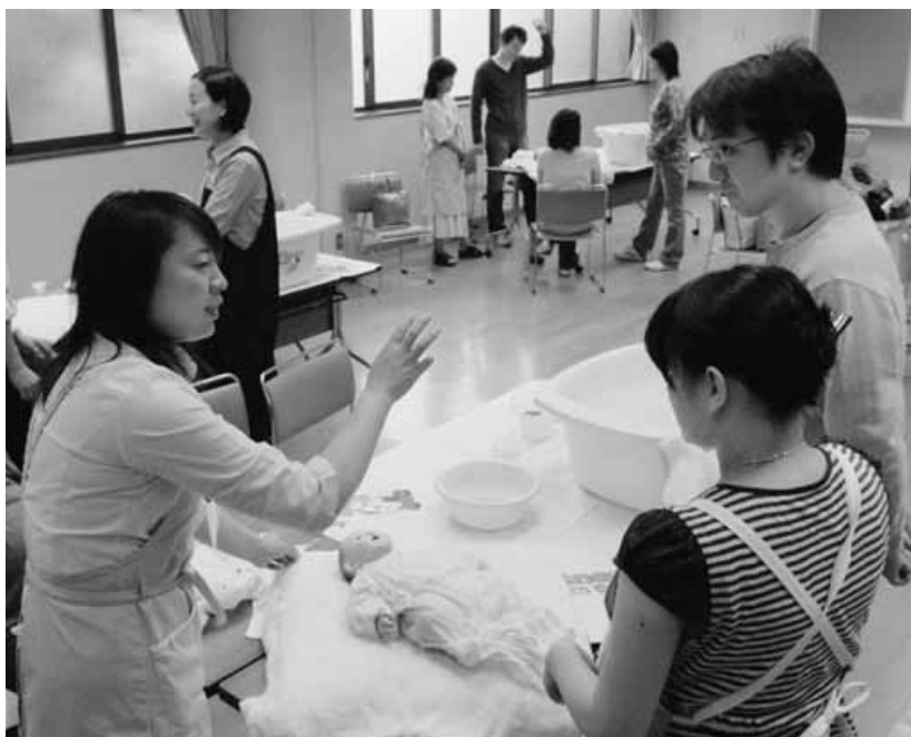
両親学級で沐浴実習を受ける参加者の皆さん

いつて、産婦人科の先生から、妊娠や出産についてのお話を聞いたり、産後4、5か月くらい先の先輩ママさんたちに来てもらって、交流会を開いたりするんだって。