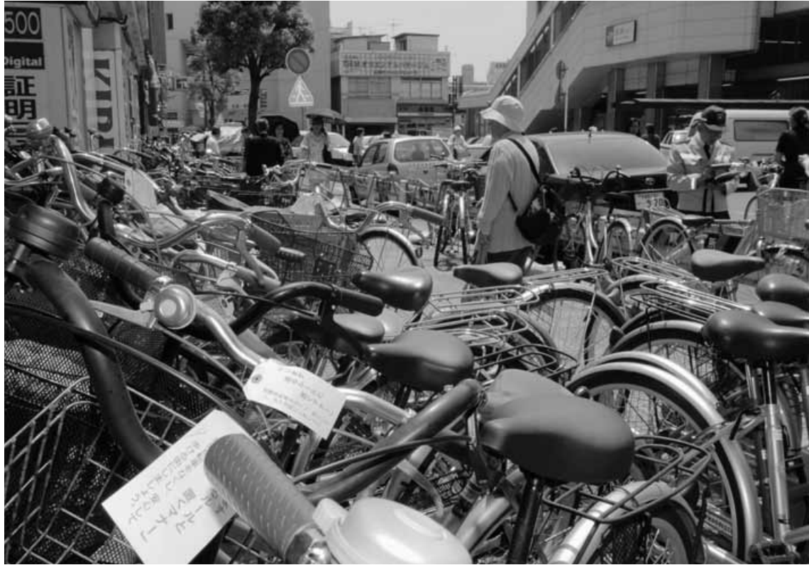
歩道を埋め尽くす放置自転車（蕨駅東口）