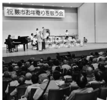
昨年のお年寄りを敬う会

生による敬老作文の朗読、マジック・歌謡ショー、歳少年少女合唱団や北四はやし会などの発表 対象〓77歳以上の人（昭和13年9月30日以前に生まれた人）問い合わせ〓介護保険室（☎433・7756）