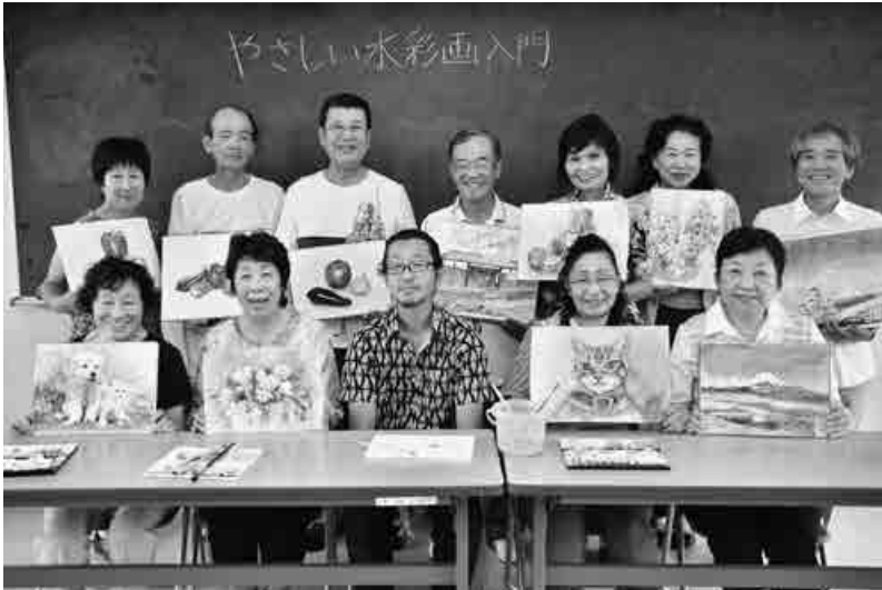
力作とともにっこり(松原会館の趣味講座「やさしい水彩画入門」の皆さん)