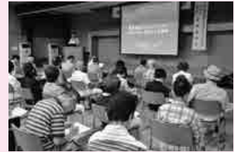
8月24日には市民体育館で講演

これまで、健康づくりを進める上で、どんな運動にどの程度取り組めばいいのかという指標がありませんでした。そこで私は、健康長寿のための共通のものさしをつくりたいと考え、平成12年から群馬県中之条町で研究を行いました。この研究では、65歳以上の全町民約5000人に活動量計を身につけてもらい、