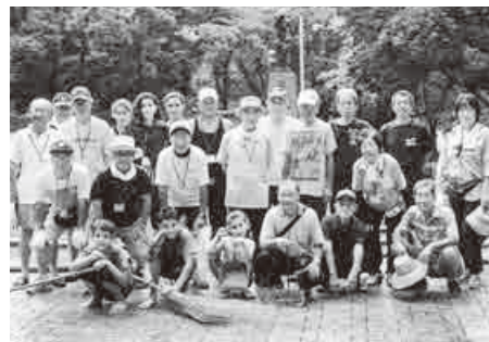
平和之母子像の清掃を終えて(8月1日)

テーションへの市民活動団体登 録などを経て、現在では、85人 の会員が所属しています。地元 をはじめ、北町や錦町地区のほ か、職場が近いなどのご縁で県 外や外国のかたもいるんですよ。 また、春には、同園で開催の 桜まつりでごみの分別指導も行 っているほか、毎年8月には、 塚越コミュニティ委員会主催の 平和事業のなかで、平和之母子 像の清掃もお手伝いしています。 こうした活動の場では、清掃 を通じて爽やかな交流も広がっ ています。皆さんも運動や散歩 がてら、参加してみませんか。 興味のあるかたは千葉(☎441・ 0275)までご連絡ください。 このコラムでは、わらび ネットワークステーション (☎445・7256)の市民活動 登録団体を紹介しています。