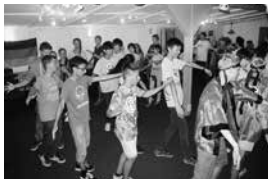
文化交流では「わらび音頭」を披露。全員で踊りに挑戦

13回目の国際青少年キャンプがドイツ東部・マッヘルン市で開かれました。「力を入れて 元気に 未来へ向かう」をテーマにドイツ、ポーランドとともに蕨市から参加した13人は、スポーツや文化交流、ホームステイなどを経験。言葉や習慣の壁を越えて育んだ友情や思い出は、今後の成長の大きな糧となることでしょう。