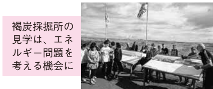
褐炭採掘所の見学は、エネルギー問題を考える機会に