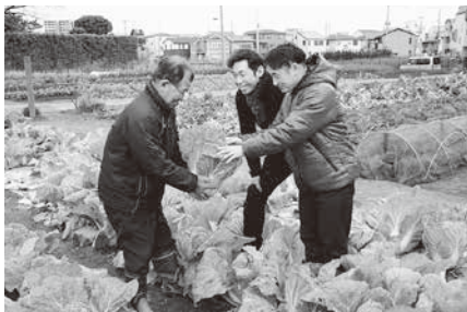
生産者(左)の話を書く飲食店の店主たち

住宅都市・蕨でとれる農作物は限られています。でも、農家のかたが丹精こめて作る野菜は新鮮でおいしいと評判で、わらび農産物直売所運営協議会の直売会(土曜日 午前9時 J A戸田市蕨支店)