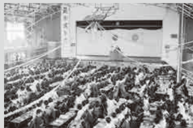
▲市民会館開設前までは中学校などが会場に（第20回・昭和41年・第二中学校）