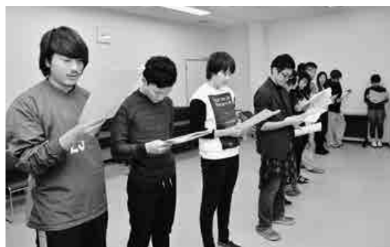
▲入念にリハーサルを繰り返す実行委員の皆さん

「成年式のご案内」が届いていない人や、蕨市出身で市外在住の出席希望者は、市役所3階生涯学習スポーツ課(☎433・7729)へご連絡ください。