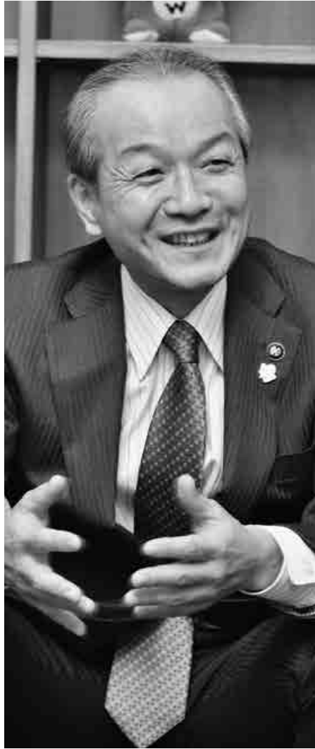
蕨市長 頼高 英雄