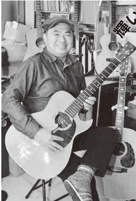
「音が出たときは感動しました」と、にっこり