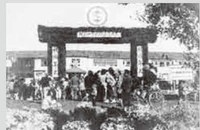
▲町立蕨中学校（現・第一中学校）の落成式も行われた第3回成年式（昭和23年）