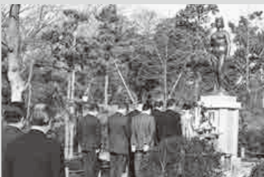
▲「成年式発祥の地記念像」の除幕式を城址公園で同日開催（第33回・昭和54年）