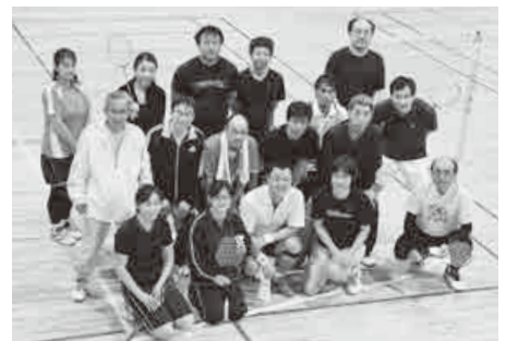
「いっしょにプレーを楽しみましょう」と、皆さん

「塚越バドミントンクラブ」は、東公民館で開かれたバドミントン教室の参加者が有志となり、設立したクラブです。昨年には創立40周年を迎え、仲間づくりやスポーツ活動の場として地域でも定着しています。現在は、55人の部員が所属し、週に4回(火曜日)午後7時半、塚越小学校、金曜日(午後7時半、東中学校、日曜日(午後3時と午後7時、東小学校)、練習に