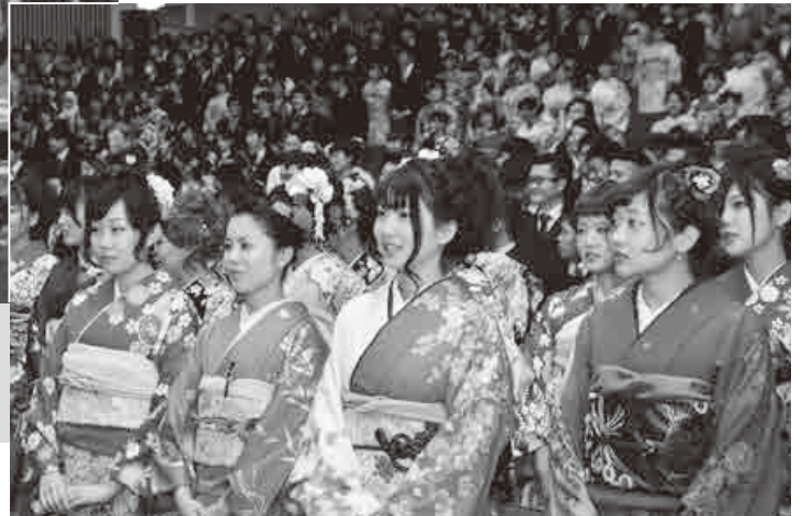
▲昭和21年11月22日。青年たちに希望を与えたこの日が現在まで続く成年式の第一歩に（第1回成年式・青年祭） ▶毎年多くの新成人が式典に出席（写真は昨年の成年式）

新成人の皆さん、おめでとうございます。今年で節目の70回目を迎える蕨の成年式は、終戦の翌年、全国に先駆けて行われた伝統ある催しです。6、7ページでは、その由来や当時の様子、今年の実行委員の皆さんの役割や式典の内容などをご紹介します。