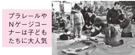
ブラレールやNゲージコーナーは子どもたちに大人気