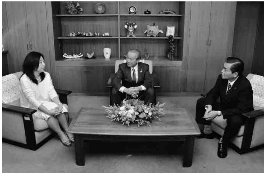
蕨の魅力や今後のまちづくりなどについて語り合う3人