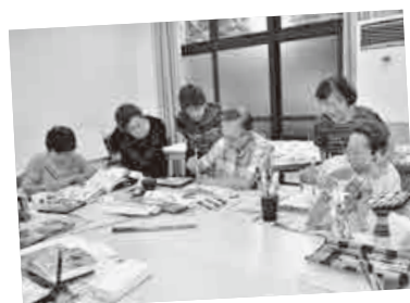
熱心に筆を運ぶ皆さん

「絵 手紙ありすは経歴者などが有志で集まり、平成18年に結成しました。現在は、絵手紙歴が3か月の初心者から20年までのメンバー8人が月2回(第2・4月曜日 午後1時)、北町公民館で筆を運んでいます。手紙に絵を添える絵手紙は、相手に思いを伝えること、そして伝わることにがたいせつです。私た