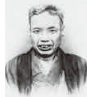
かわなべ きょうさい 河鍋 暁斎 天保2年(1831) ～明治22年(1889)

現在の茨城県古河市で生まれる。浮世絵や狩野派を学び、江戸・東京の庶民から人気を博す。明治9年、万国博覧会に肉筆画を出品。14年、内国勲業博覧会で日本画の最高賞受賞。娘の暁翠も日本画家。