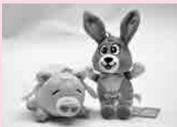
ワラビー(写真右)とエンジェルわらぶー(同左)のぬいぐるみ(価格はいずれも500円)

蔵の人気者ワラビーとTHE ALFEEの高見沢俊彦さんデザインのエンジェルわらぶーが、手のひらサイズのぬいぐるみになりました。ワラビーファンシーセット(文房具などの詰め合わせ)とともに市役所1階市民活動推進室で販売中です。ぜひ、お買い求めください。詳細=政策企画室(☎433・7698)