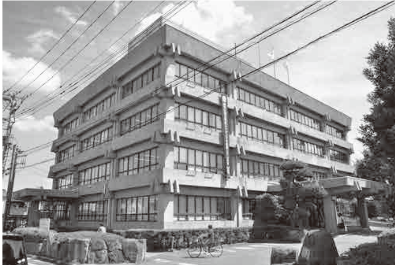
市民サービスや災害時における災害対応の拠点となる市役所

今月の特集・市政スポットでは、現在市が進めている取り組みのなかから、蕨市役所庁舎耐震化整備方法に関する市民アンケートの結果と、原付バイク用ご当地ナンバープレートの作製についてお伝えします。