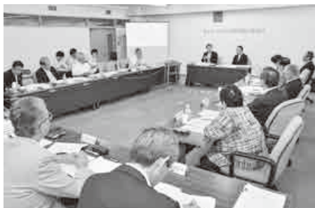
第1回目の蕨市庁舎整備検討審議会(5月31日)

学識経験者や公共的団体等の代表、市議会議員、公募市民による委員13人で構成。今年5月からこれまで4回の会議が開催されました。今月11日には5回目を開催し、市長に「耐震改修か建替えか、また建替えの場合は建設場所はどことするか」の諮問について答申される予定です。