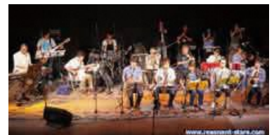
Resonant Stars Jazz Orchestra

アンサンブル、ラテンフュージョン、4ビートなど、幅広いジャズの世界が繰り広げられるコンサート。皆さんお気軽にお越しください!