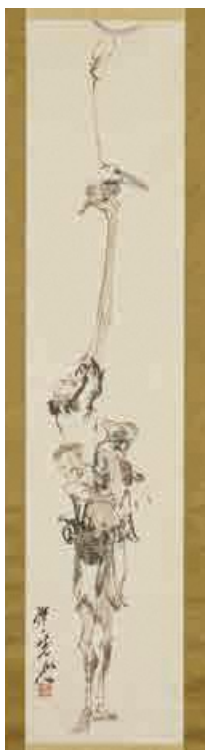
本作品は現在の展示会で御覧いただけます