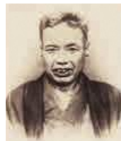
かわなべ きょうさい 河鍋 暁斎 天保2年(1831) ~ 明治22年(1889)

現在の茨城県古河市に生まれる。浮世絵や狩野派を学び、江戸・東京の庶民から人気を博す。明治9年、万国博覧会に肉筆画を出品。14年、内国勲業博覧会で日本画の最高賞受賞。娘の暁翠も日本画家。