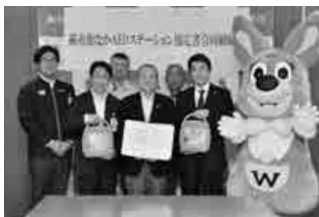
▲先月15日の協定締結式の様子

市民の皆さんが昼夜を問わずAEDを使用できる環境を整えるため、今月から市内の24時間営業のコンビニエンスストアとガソリンスタンド32店舗にAEDを設置。これに先立ち、先月15日、消防本部で市と各事業者との間で協定締結式を行いました。