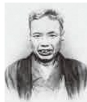
かわなべ きょうさい 河鍋 暁斎 天保2年(1831) ～明治22年(1889)

現在の茨城県古河市に生まれる。浮世絵や狩野派を学び、江戸・東京の庶民から人気を博す。明治9年、万国博覧会に肉筆画を出品。14年、内国勲業博覧会で日本画の最高賞受賞。娘の暁翠も日本画家。