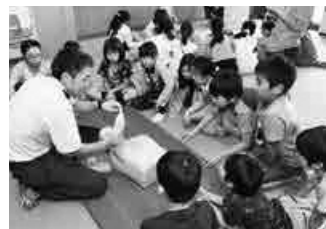
▲中央小学校で行われた講習会