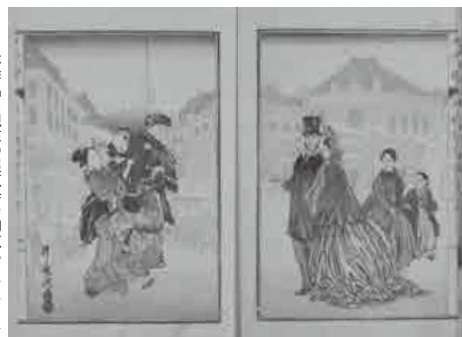
本作品は現在の展覧会で御覧いただけます