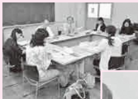
◀ 従来よりも教職員研修や教育課題の研究の中心的機能を有することになりました