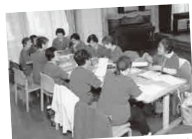
活動の前に勉強会を行っている皆さん

傾聴ボランティアは、主に高齢のかたのお話に耳を傾け、真摯に聴く取り組みです。毎月1回、北町の蕨サンクチュアリで午前9時から勉強会を行い、その後は、同施設利用者のかたを対象に傾聴を行っています。