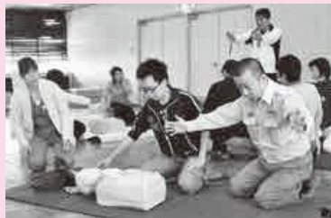
普通救命講習会の様子