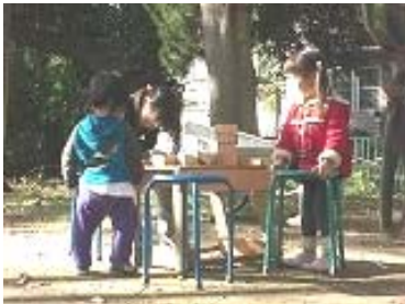
未就園児対象プレーパーク「けろっこぱーく」。小さい子同士の関わりも、すぐに親が入らないで見守ってみて。子どもの世界が見えてきますよ。

小さくたって思いっきり遊ぼう！と未就園児対象のプレーパーク「けろっこぱーく」を、平日に月1回開催し、自然が残る広場で自由に遊びました。また、6・7月に「ロープワーク講習会」で大きなハンモック作り、11月は渋谷はるのおがわプレーパークへ遊びに、1月は講演会「『見守る』ことから生まれるもの」を行い、遊びのヒント、子どもとのいい距離感が必要ということ学びました。