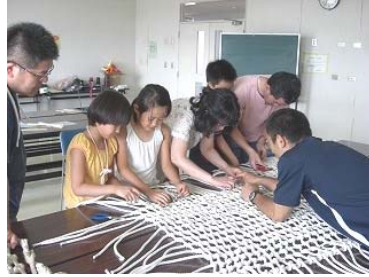
「ロープワーク講習会」でハンモックを作っている様子。大きなハンモック完成を目指し、みんなで協力して一目一目編みました。