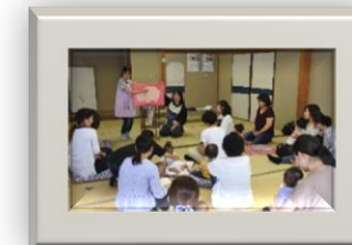
0歳ママのふれあい広場 親子体操や紙芝居、工作を して楽しんでいます。