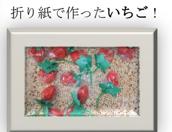
折り紙で作ったいちご！