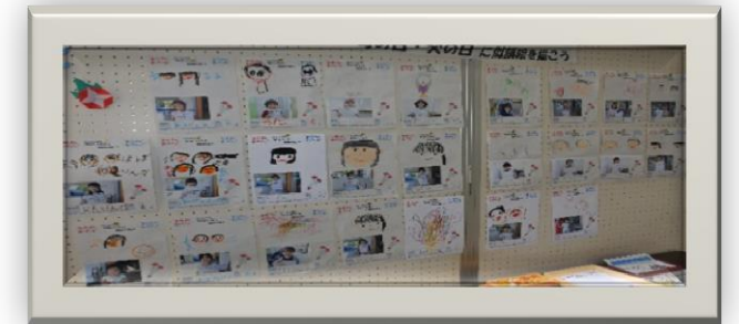
「母の日・父の日に似顔絵を描こう」 たくさんのお子さんが参加してくれました。