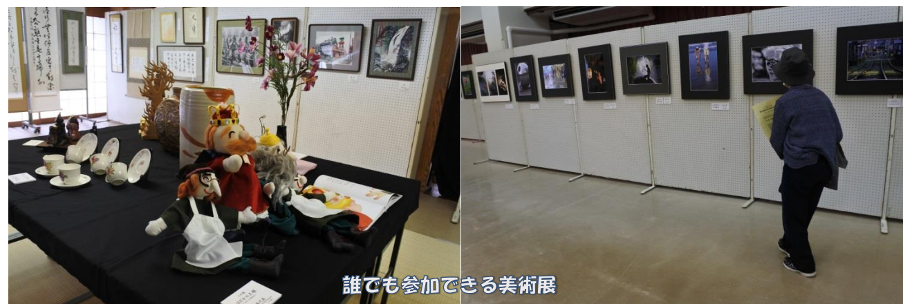
誰でも参加できる美術展

第23回『桜のまち南町文化展』が、3月17日(土)・18日(日)に開催され、2日間で延べ417名の来場がありました。