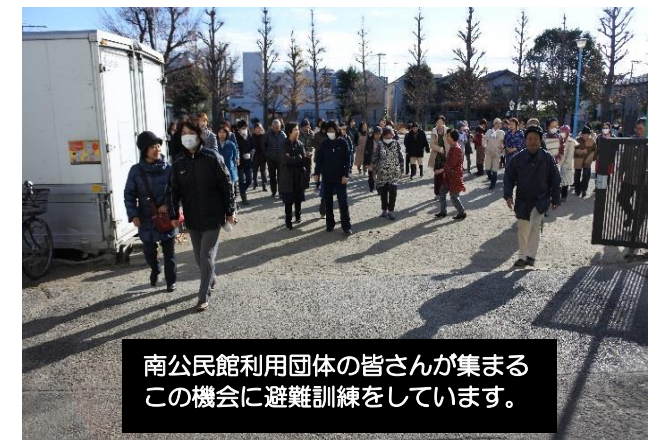
南公民館利用団体の皆さんが集まるこの機会に避難訓練をしています。

◆倉庫の掃除・備品整理について◆ 館内の倉庫、ロッカー、物置等を利用している団体は、当日までに掃除と機材・備品等の確認、整理整頓をお願いいたします。 ※不明または所定の場所外にある備品は館側で処分させていただきます。ご承知おきください。