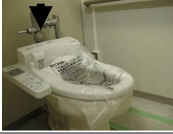
公民館1Fトイレ 便座に洗浄機能

中央公民館・市民会館・勤労青少年ホーム 施設の一般利用再開は1月7日から 今年の7月から全面休館して耐震補強等工事を行っていた中央公民館・市民会館・勤労青少年ホームの複合施設)の工事が年内で終了し、年明けの1月7日から、一般の利用が再開されます。約半年の間、皆様にはたいへんご不便・