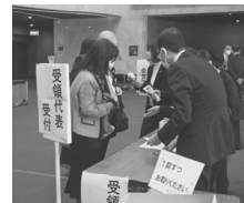
第68回 埼玉県更生保護大会