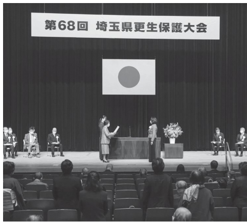
第68回 埼玉県更生保護大会