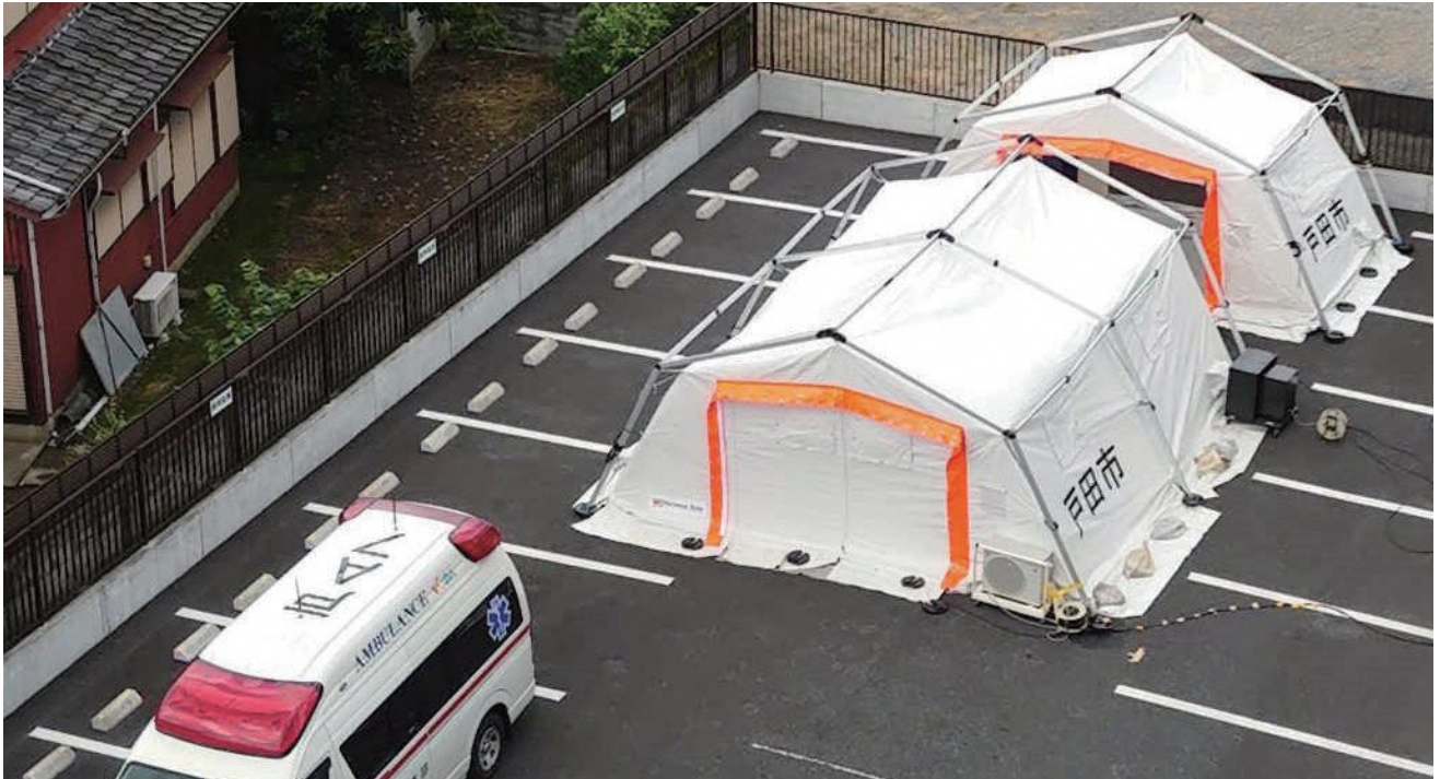
戸田市コロナ禍対策入院待機ステーション

蕨・戸田地区保護司会の皆様におかれましては、長く続くコロナ禍の中、対象者との面接や予定されていた行事等の見直し等について大変な御苦労を続けておられると共に、このような状況下にあっても、様々な工夫を凝らし地域で活動を続けておられるものと拝察します。本当に有難うございます。 「再犯防止のためには、社会の中につながりを作り出すことが必要だと考えます。この糸口を保護司の皆様が生み出していただいているのです。」 これは、本紙創刊号にさいたま保護観察所長として寄稿させていただきました拙稿の一節です。この思いは、今も変わっておりません。むしろ、コロナ禍を経験することにより、ますます強まっています。 皆様方に対象者を担当いただき、本人や家族とのやりとりを通じて、本人には自覚が芽生え、家族には本人を理解しようという気持ちが生ま