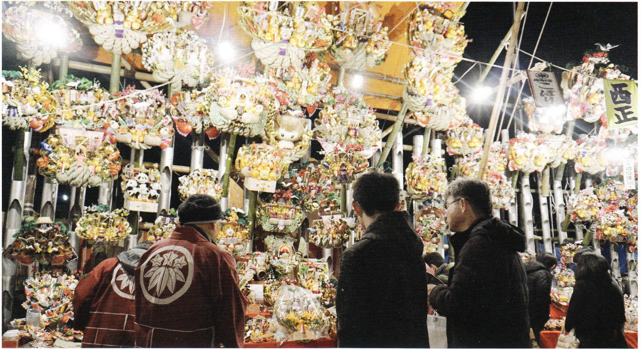
和楽備神社のおかめ市 毎年12月17日、手締めと威勢のいい声が飛び交う境内には縁起物の熊手が並びます