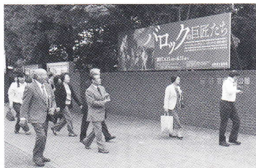
山梨県立美術館に参観した保護司の皆さん

平成29年5月16日、毎年恒例の矯正施設参観を行いました。参観先は山梨県甲府市の甲府刑務所、参加者は蕨市・戸田市から31名の保護司と事務局の33名でした。 甲府刑務所は、山梨県でただ一つの行刑施設で未決拘留者を収容する拘留区も併設されています。収容分類はB級と言いい、成人再犯者で刑期8年未満の短期処遇の男子刑務所です。収容定員は600名で内訳は薬物乱用者や窃盗累犯者が6割を占め、