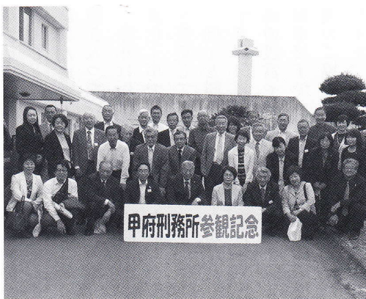
参観された蕨市・戸田市の保護司の皆さん

平成29年5月16日、毎年恒例の矯正施設参観を行いました。参観先は山梨県甲府市の甲府刑務所、参加者は蕨市・戸田市から31名の保護司と事務局の33名でした。 甲府刑務所は、山梨県でただ一つの行刑施設で未決拘留者を収容する拘留区も併設されています。収容分類はB級と言いい、成人再犯者で刑期8年未満の短期処遇の男子刑務所です。収容定員は600名で内訳は薬物乱用者や窃盗累犯者が6割を占め、