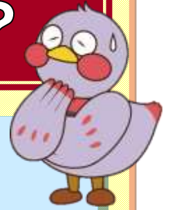
埼玉県のマスコット 「さいたまもち」

平成30年6月18日の大阪府北部を震源とする地震では塀の倒壊により、尊い命が奪われました。