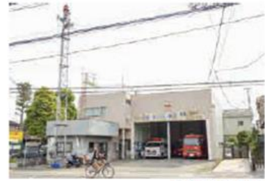
旧消防署塚越分署