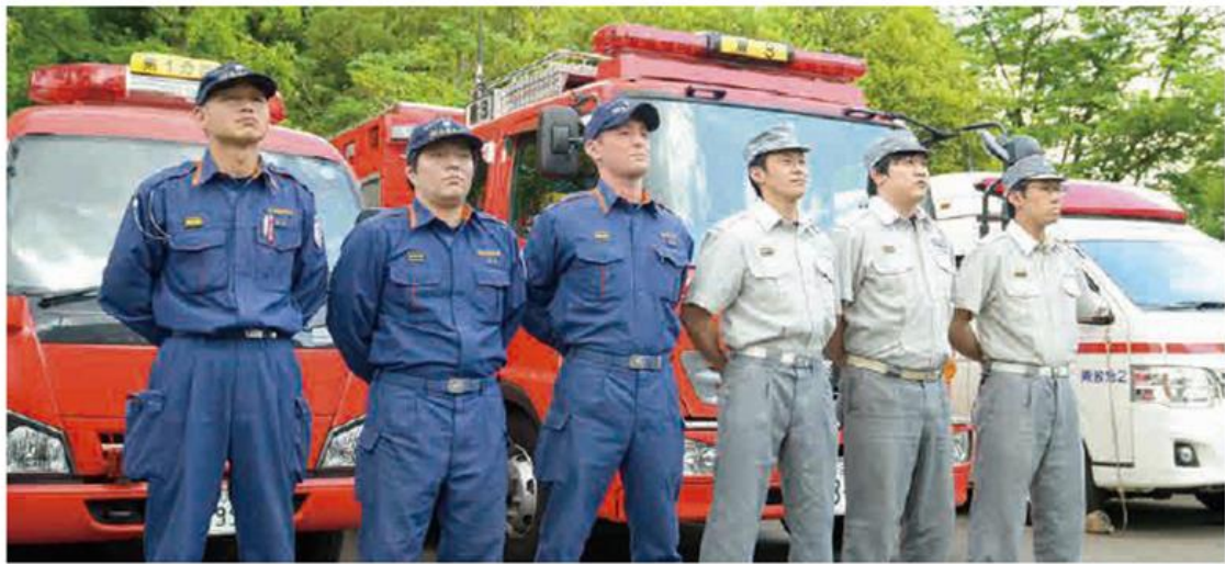
消防署塚越分署隊員