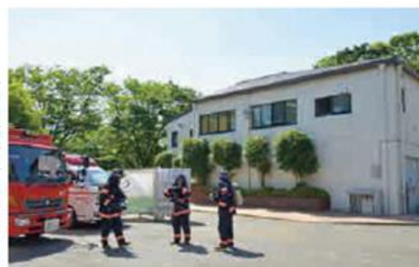
一時移転先の市民公園管理棟