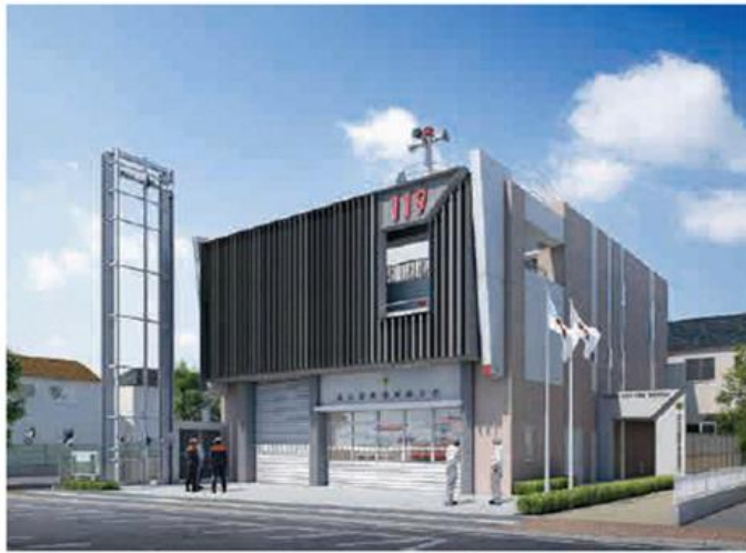
消防署塚越分署の建替え後の完成イメージ