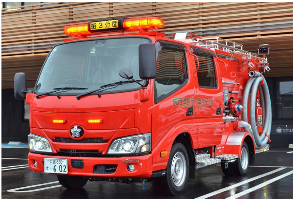
令和6年2月 蕨市消防団第3分団 消防ポンプ自動車