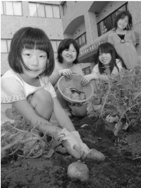
手作り菜園で初収穫