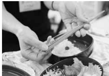
優しさの「環境行動」

「いっぱい野菜が採れました」。中央4丁目にある福祉・児童センターで、6月中旬に、約50個のジャガイモとナスが収穫できました。育てたのは同センターに通う7人の子どもたちです。今年3月にジャガイモ12株、ナス2株を畳3枚ほどの敷地に植え、収穫への思いをこめて菜園の看板も作りました。これまで、たくさん日が当たるようにと、周りにある樹木の剪定作業をお手伝いしたほか、水やりや草刈りなどをしながら丹精こめて育ててきた野菜です。とげがついたナスに驚き、土の中から出てくるジャガイモとの初対面に顔をほころばせた後、採れたての野菜で作ったカレーをおなかいっぱい食べました。