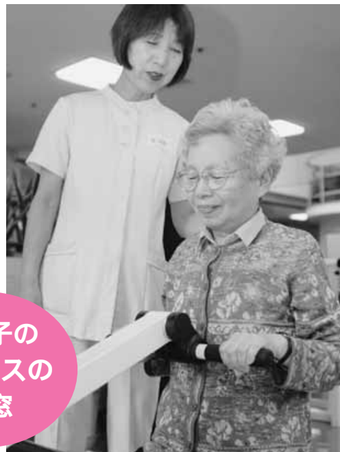
藤井サイバーセンターで行われた 介護予防教室