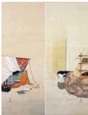
暁翠筆「紫式部・清少納言図」 絹本墨画彩色 軸装 双幅