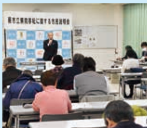
▲2月13日・北町公民館

A. 西公民館と松原会館は、市民のかたから寄附していただいた錦町5丁目の土地に、複合施設として新たに移転整備する計画です。移転に当たっては、地域の皆さんの声をお聴きしながら、検討を進めていきます。