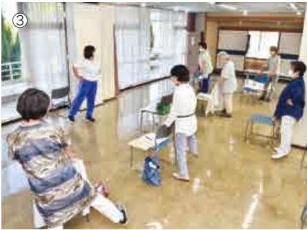
①②いきいき百歳体操をする「いきいきグリーン」の皆さん ③令和5年度フレイル予防教室でのひとこま

年齢を重ねても自分らしく充実した生活を送るためには、介護予防が重要です。ここでは、いきいき百歳体操とフレイル予防教室について紹介します。