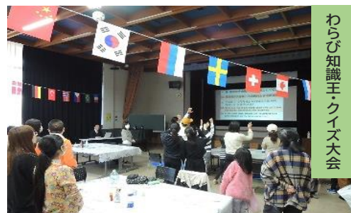
わらび知識王クイズ大会

令和5年12月10日(日)に中央公民館で「みんなの広場」を開催しました。今回の広場は、外国人と日本人が互いに理解し合い一緒に暮らしやすいまちを作ろう!をテーマに『食を通じて交流しよう』と題して行いました。参加者は3カ国52人。当日は中国や日本をはじめ、珍しい(?)ベトナムとネパールの餃子を作って食べ比べで、各国の文化の違いを味わいました。そのほか、わらび知識王クイズ大会やジャンケン大会などを楽しみ、イベントのフィナーレでは「幸せなら手をたたこう」を輪になって踊り、「みんなの広場」らしい参加者同士の交流を育みました。