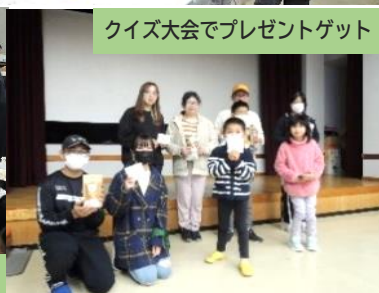
クイズ大会でプレゼントゲット